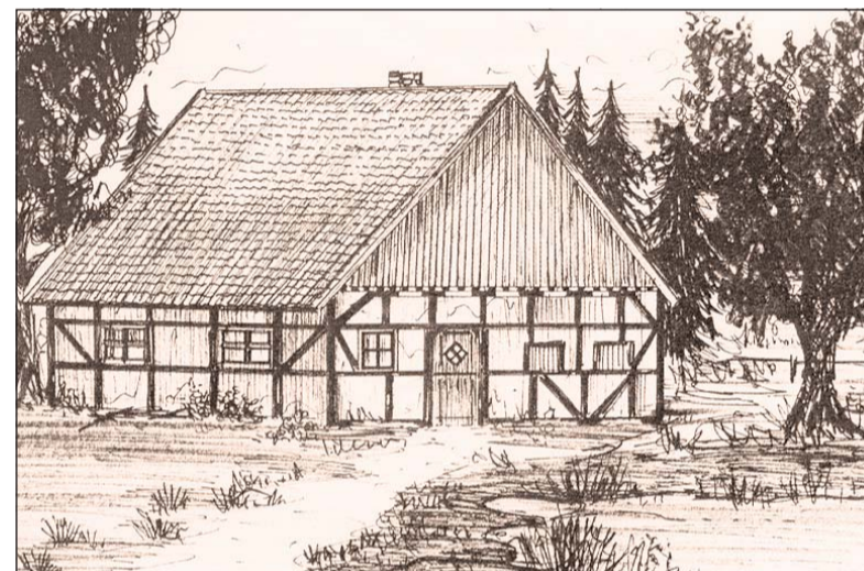
In einem armselig wirkenden Zieglerkotten gab es von 1910 an Gottesdienste. Die Gemeindeglieder nannten das Haus liebevoll »Nobben-Villa«.

Heute bekennen sich zur NAK weltweit etwa 11 Millionen Mitglieder. Insgesamt bestehen 60 000 Gemeinden, in Deutschland stehen den Mitgliedern 2400 Kirchengebäude zur Verfügung, davon 13 in der Region Bielefeld.